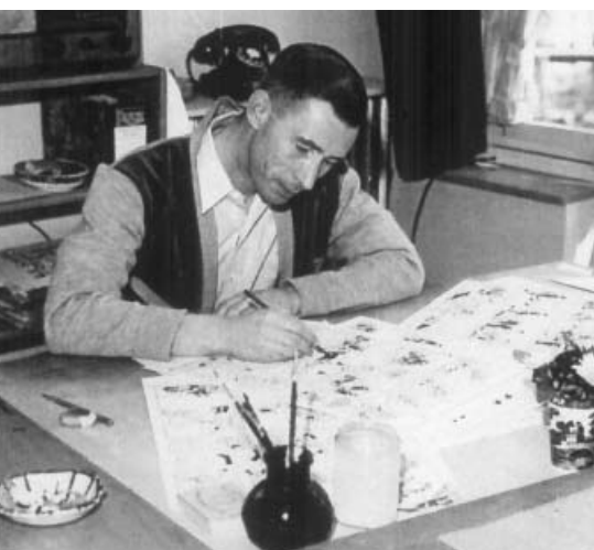
Georges Remi (Hergé) appréciait tant les rivages du Léman qu'il a décidé d'en faire le cadre de «L'affaire Tournesol».

En 2007, Hergé aurait eu cent ans. À l'occasion de cet anniversaire, la Poste sortira deux entiers philatéliques illustrés par des vignettes de «L'affaire Tournesol», le plus suisse des albums de Tintin, puisque une partie de l'intrigue se déroule dans notre pays. Mais cette aventure très «helvétique» n'est que la pointe visible de l'iceberg; en effet, Hergé entretenait une véritable amitié avec la Suisse, qu'il n'hésitait pas à qualifier de «paradis sur terre»!