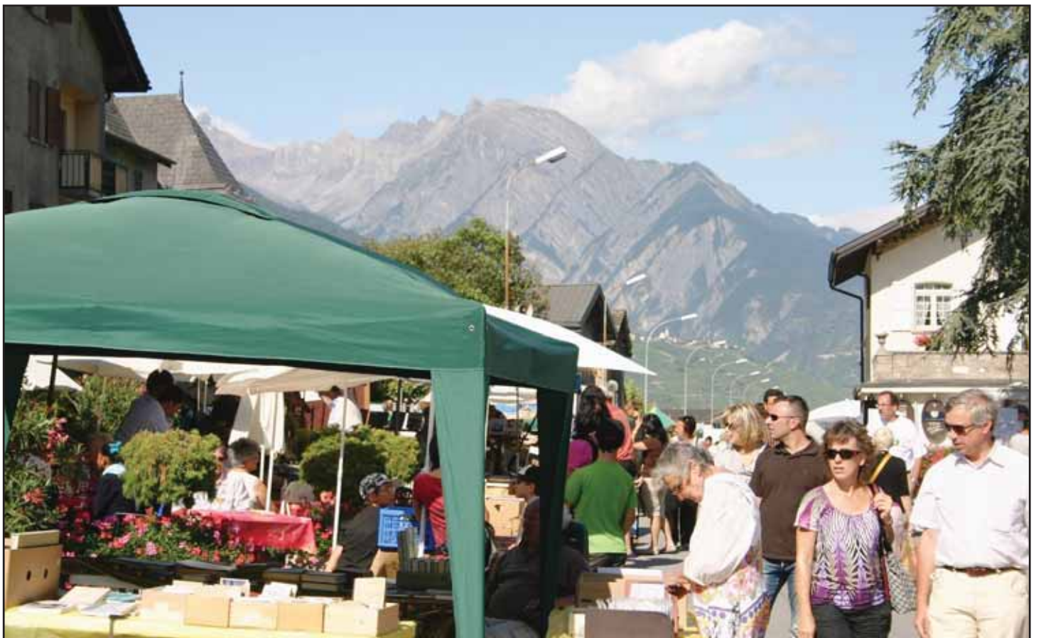
Des milliers de lecteurs seront une nouvelle fois comblés par le choix des livres mais aussi par toutes les expositions et les animations organisées durant les trois jours de rencontre.

On raconte qu'Hergé était fasciné par les paysages montagneux des Alpes. Il a d'ailleurs en 1967 séjourné durant six semaines aux Marécottes. Pour la petite histoire, l'acteur qui a incarné Tintin sur grand écran, Jean-Pierre Talbot, fréquente lui assidûment la région. L'un des Valaisans les plus connus en Suisse, Pascal Couchepin, fera peut-être halte au village du livre en fin de semaine. L'ancien président de la Confédération a avoué aux membres d'Alpart qu'il avait lu «avec enthousiasme» dans sa jeunesse le journal «Tintin».