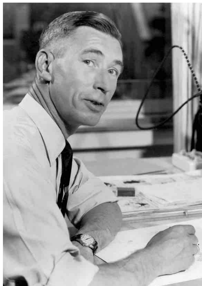
Keystone-a / Hergé Moulinsart 2007

L'étude Tintin reporter de L'Echo illustré au pays des Helvètes peut être consultée à la Bibliothèque publique de Bulle.